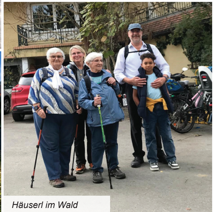
Häuserl im Wald