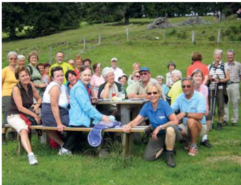
Wanderung beim alten Almhaus